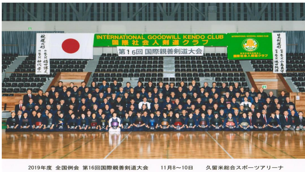
2019年度 全国例会 第16回国際親善剣道大会 11月8～10日 久留米総合スポーツアリーナ

全国例会への参加の皆様大変にお疲れ様でした。選手の皆さんは、大変に健闘されました。そして、協賛及び名刺交換にご協力の皆さま、大変ありがとうございました。改めて感謝を申し上げます。