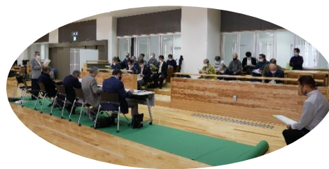
会長挨拶と総会の様子