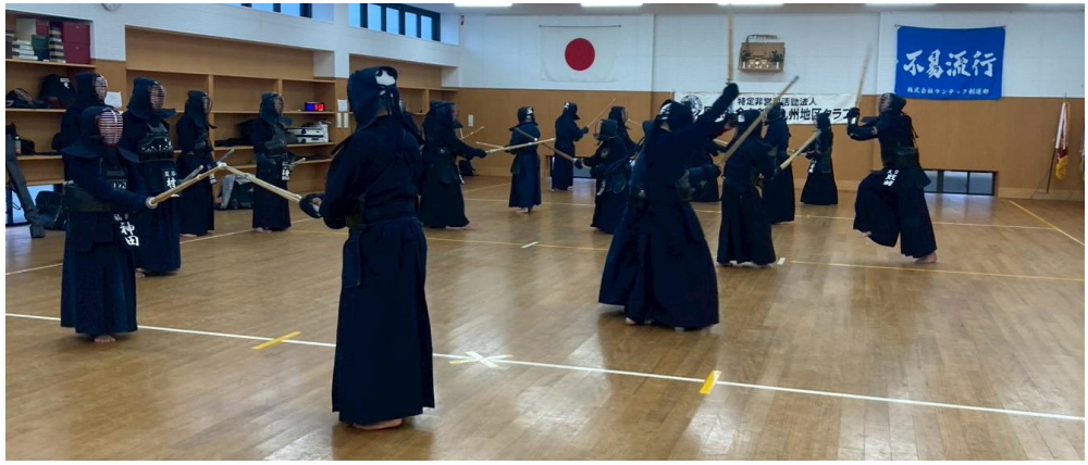
(有志による自由稽古風景)