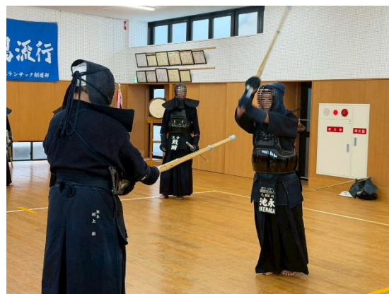
(池永八段による基本指導稽古風景)

【全員での回り稽古】 基本稽古後、八段参加の3分回り稽古を4本ごとに一分休憩を入れ4回実施して、今回は全国例会の話もあるので5分早めに終了。